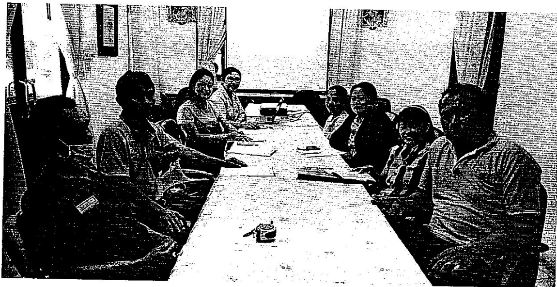
ประชุมกลุ่มงานบริหารทั่วไป วันที่ ๑๓ มีนาคม ๒๕๖๓